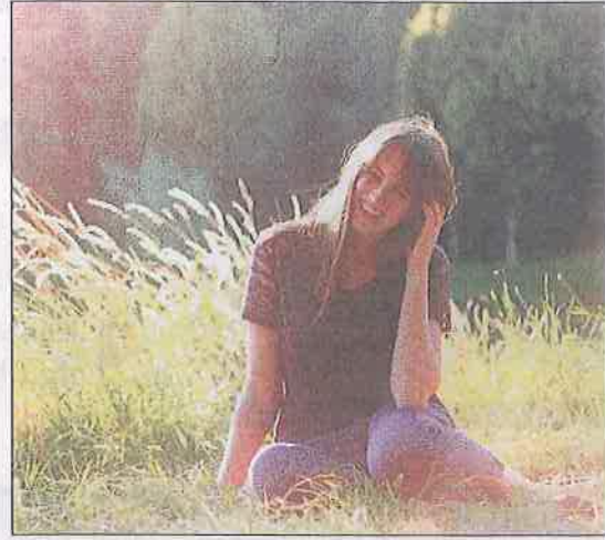
■ Singer-songwriter Lisette Lowe.