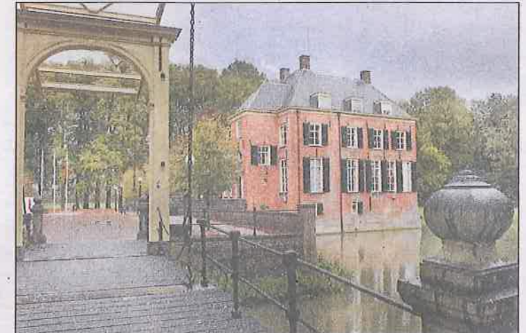
■ Kasteel Neerijnen, waar het slotconcert wordt gehouden op zondag 28 september.

tern, muzikent De Plantage in Culemborg, Vismarkt in Zaltbommel en de Agatha Capel in Kappel-Avezaath. Daarnaast doen ook bekende monumenten mee aan het festival. Een greep: Stroomhuis en kasteel in Neerijnen, Sint Maartenskerk Zaltbommel, Marechausemuseum (Weeshuis) en Lambertuskerk in Buren, Heerlijkheid Mariënwaerd in Beesd en Werk aan het Spoel in Culemborg. Het Korenbeursplein in Tiel vormt op 21 september het decor voor een singer-songwriteravond met zes artiesten.